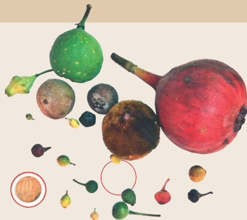
Diversidade de forma e tamanho de folhas e frutos de figueiras encontradas em uma única localidade da China. Note, nas duas fotos, as dimensões em relação a uma moeda de 10 centavos de real (no círculo vermelho)

que as raízes ‘estrangulam’ o tronco que lhes deu sustentação, a figueira toma o lugar da árvore. Um terceiro grupo é representado por figueiras incapazes de sustentar o próprio peso. Essas plantas iniciam seu desenvolvimento no solo e crescem agarrando-se a superfícies rochosas ou ao tronco de outras plantas. Esse tipo de crescimento ocorre na falsa-hera (ou unha-de-gato), que é, de fato, uma figueira ( Ficus pumila ).