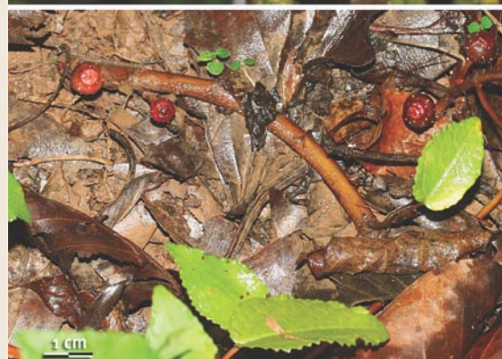
Diferentes modos de produção de figos. Acima, crescem nas ‘axilas’ das folhas de uma figueira brasileira ( Ficus luschnatiana ). Ao centro, figos produzidos por cauliflora em uma figueira asiática ( Ficus fistulosa ). Abaixo, um exemplo de produção de figos junto ao solo na espécie Ficus tikoua